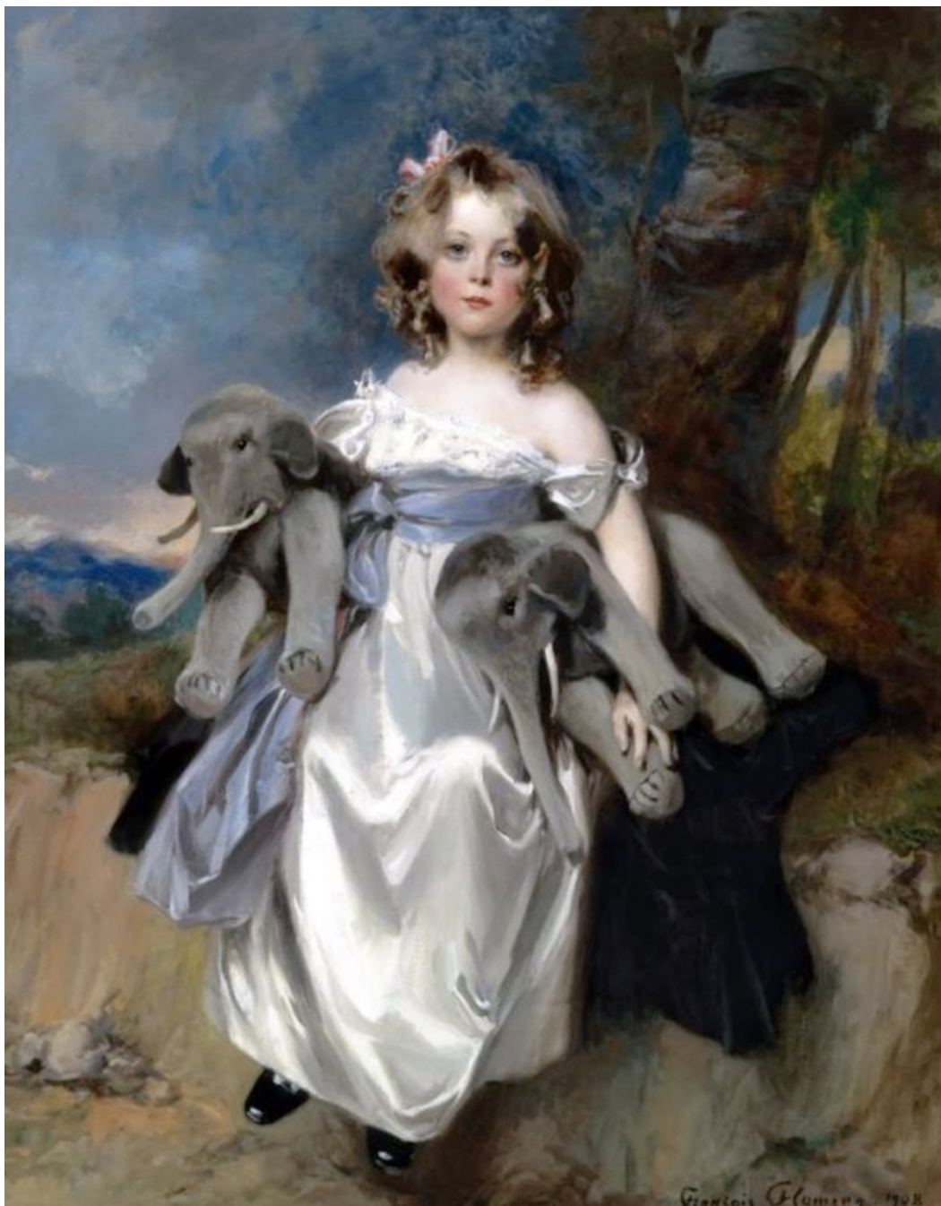
Portrait de Mademoiselle de Herpin, François Flameng, huile sur toile (années 1900)