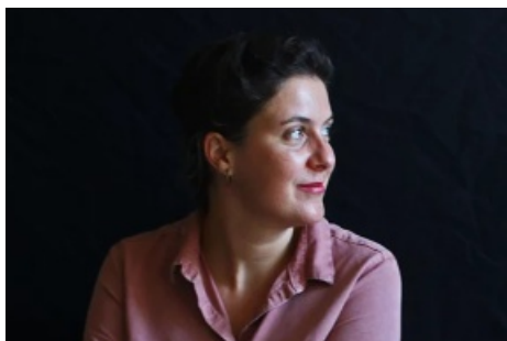
Camille DRAI (Cie Sans Visage) / Scénographie

Camille Drai commence sa formation par un BTS Design d'Espace à Toulouse en 2011, et un Master 1 Design d'Espace à l'Ecole Nationale Supérieure des Beaux Arts de Lyon en 2014.