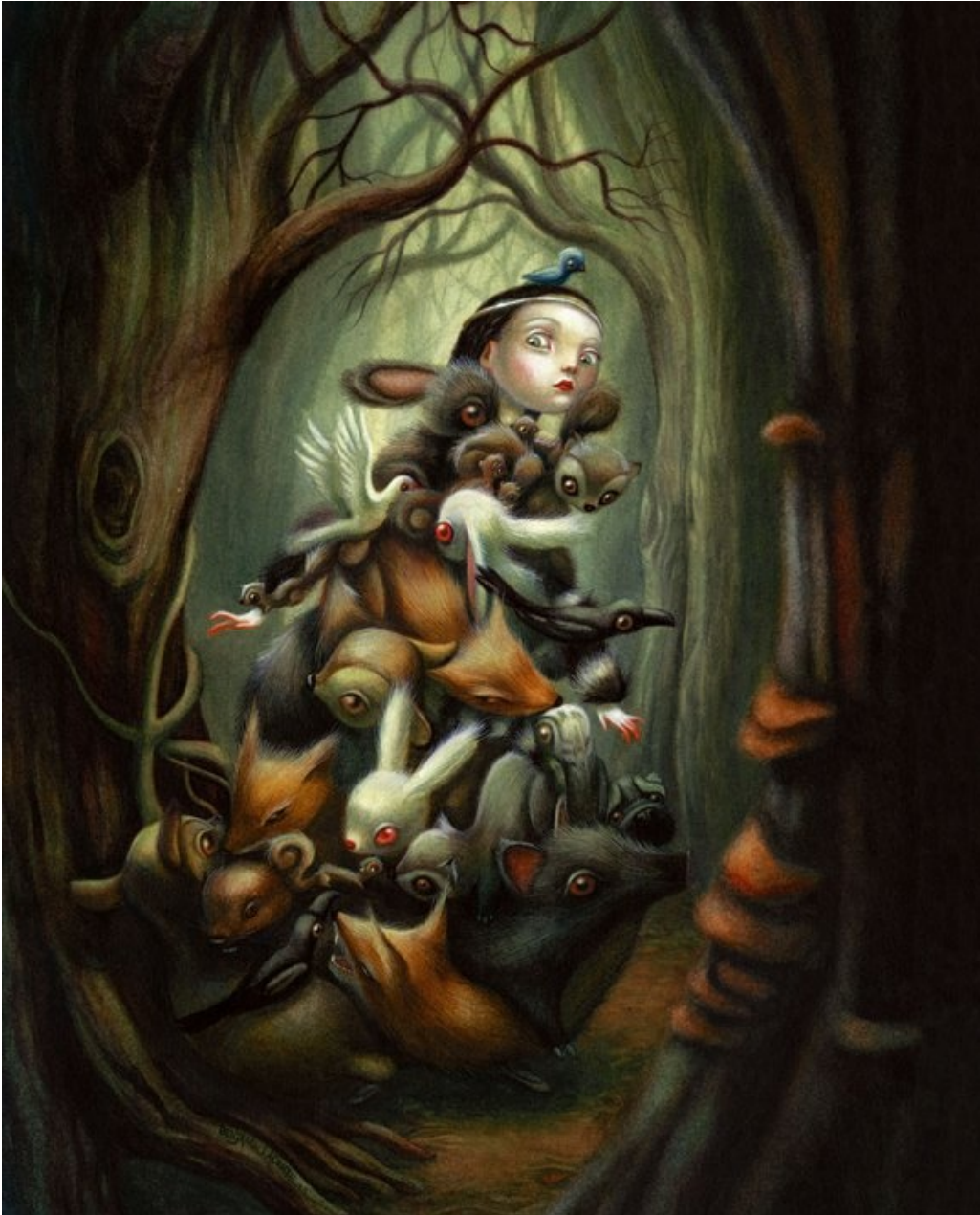
Blanche Neige, illustration de Benjamin Lacombe, Éditions Milan, 2010