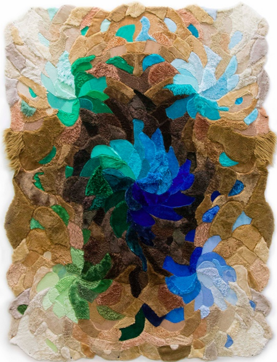
Pluma, installation d'Agustina Woodgate, 2016